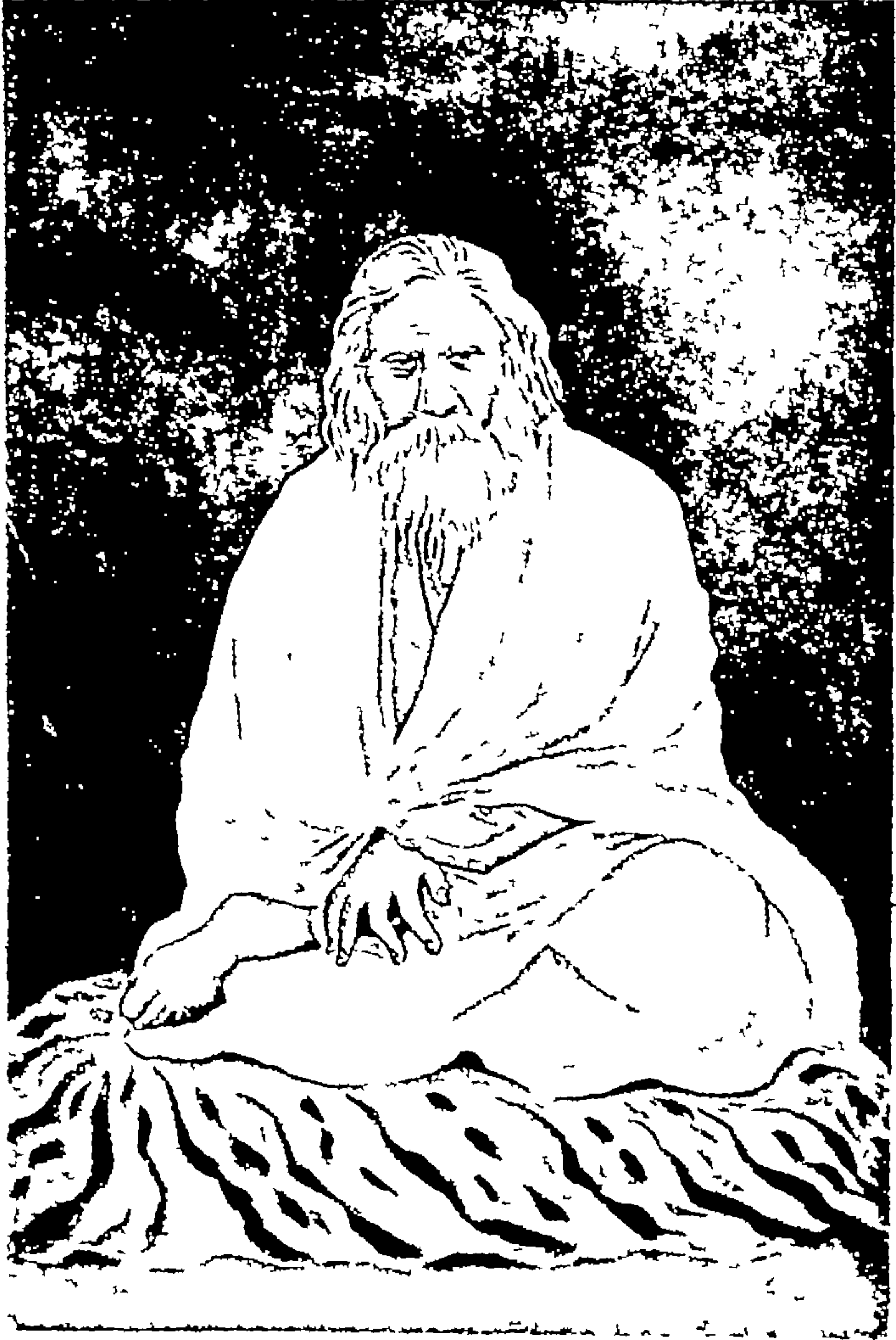
सन्त योगीराज गम्भोरनाथ